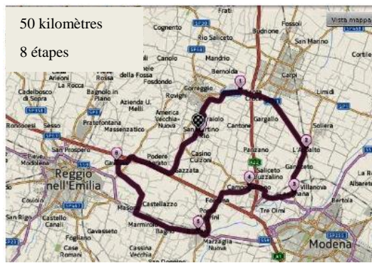
Figure 3 – Le circuit du Tour d'Émilie en 2013