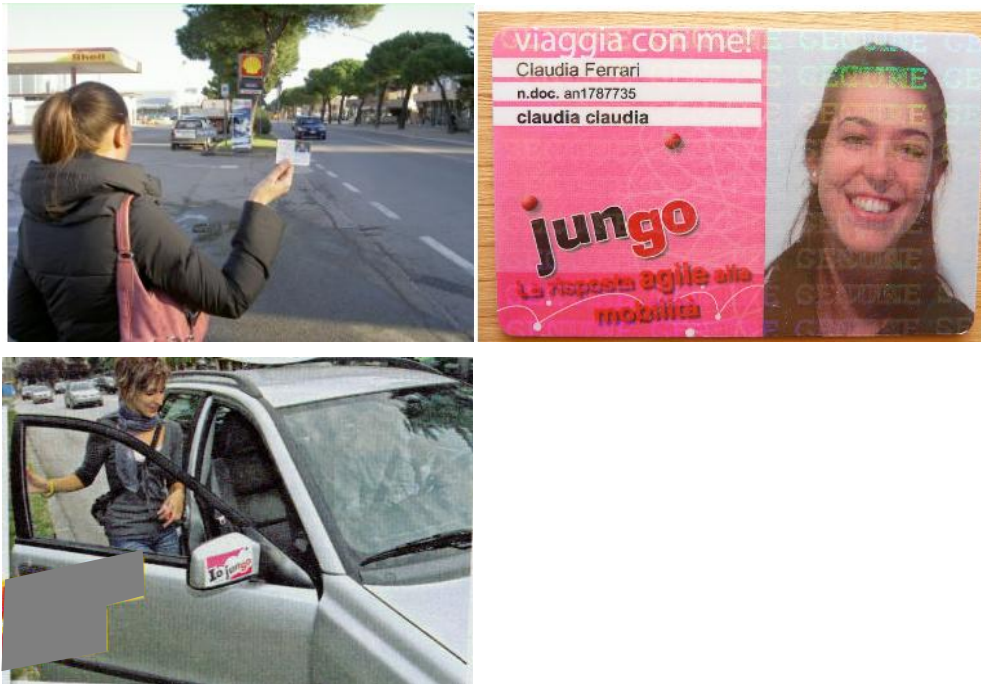
Figure 4 – Le matériel utilisé par les passagers et les conducteurs