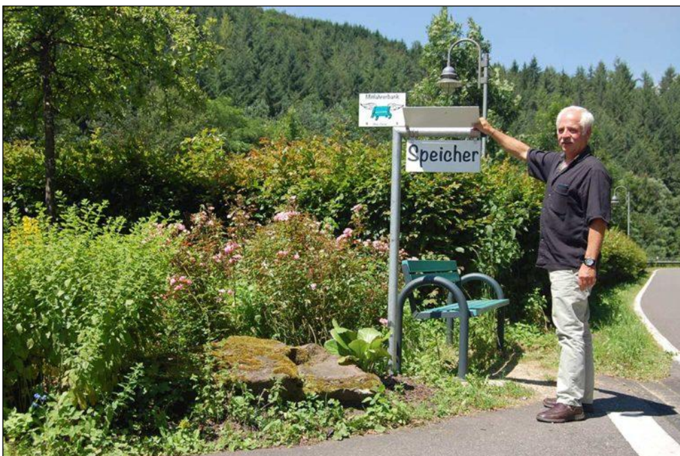
Figure 2 – Banc et poteau

Le Réseau de Mobilité de la Communauté de Communes de Speicher (ci-après le Réseau) a été créé pour développer le système et notamment pour réunir des fonds. Il a tenu sa première réunion en novembre 2014. À ce moment, la version en ligne d'un célèbre journal allemande (Spiegel en ligne, Kulturspiegel) lançait un concours d'idées innovantes dans le domaine de la qualité de la vie urbaine. Le Réseau a participé au concours avec son idée de banc des passagers qui a été plébiscitée lors d'un vote en ligne (68% !) et qui a remporté un prix de 2 500 €. Grâce à cet argent et à la réputation acquise, le Réseau est devenu assez solide pour installer plusieurs autres bancs. Le projet était sur les rails.