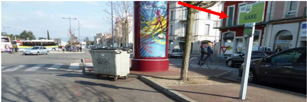
Figure 4 - arrêt de la gare (arrêt central de la ville de Romans/Isère)