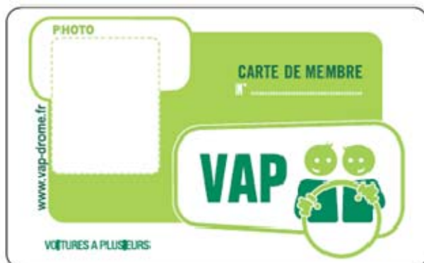
Figure 2 – Carte de membre et fiche de destination