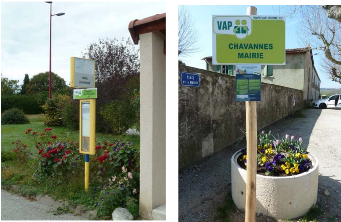
Figure 3 – Exemples d'arrêts jumelés ou non avec les transports en commun

La localisation des arrêts est décidée en concertation par la gestionnaire du réseau, la mairie et le service de la voirie du Conseil Général. Les normes de sécurité ne sont pas écrites mais intègrent au moins les deux règles suivantes : (1) le passager doit être visible sans se placer sur la chaussée et (2) le conducteur doit avoir un ou deux emplacements de stationnement pour pouvoir s'arrêter hors de la chaussée.