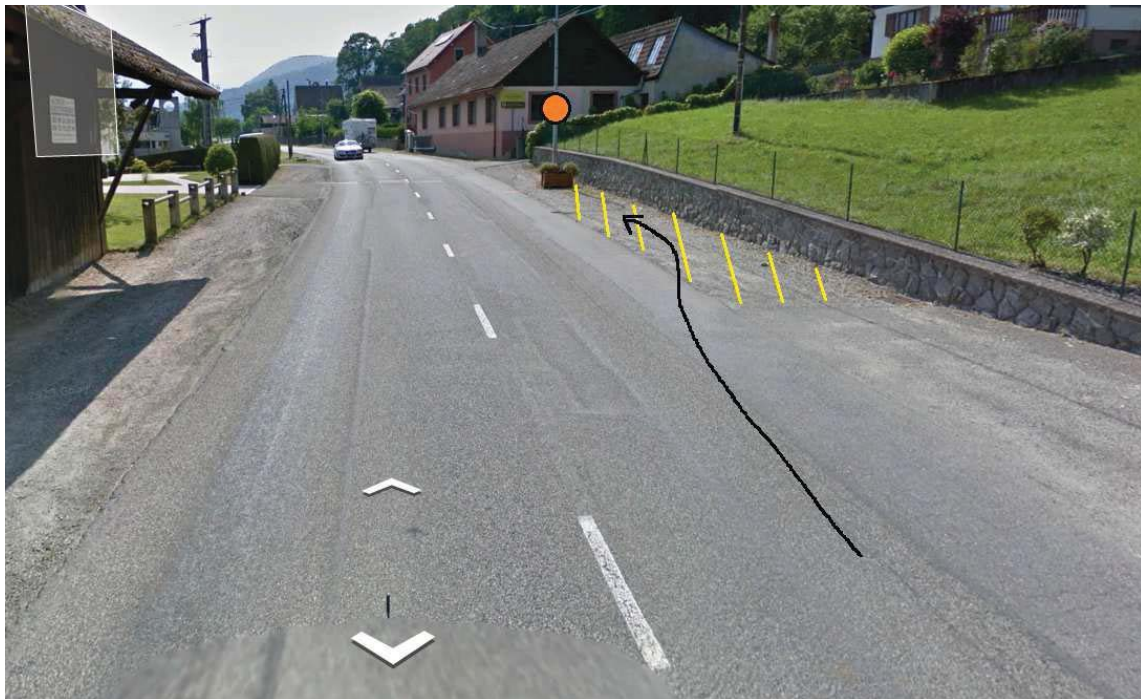
Figure 4 – Point d'arrêt recommandé

L'autostoppeur montre son carton (voir Figure 3) ou une fiche de destination. Cependant, la configuration de la vallée rend la fiche de destination le plus souvent inutile. Conducteur et passager s'engagent à adopter un comportement respectueux (notamment à éviter de fumer, de téléphoner, de boire ou de manger). Le trajet est gratuit.