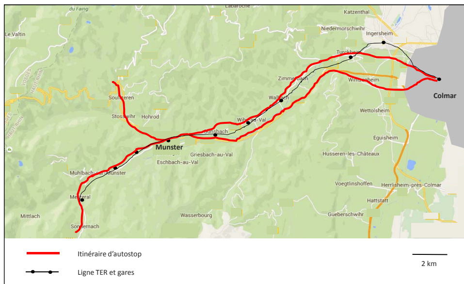
Figure 2 – La vallée de Munster

La ligne TER Colmar – Munster – Metzeral dessert seize gares distantes de 1600 m les unes des autres en moyenne avec un haut niveau de service (16 à 33 AR par jour de semaine entre 6h et 22h).