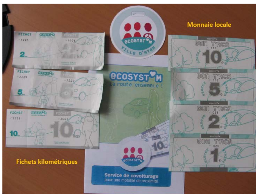
Figure 2 – Exemples de fichets kilométriques et de billets de la monnaie locale

Les macarons, carnets de fichets kilométriques et billets Y'ACA ont été conçus par la Fédération EcoSyst'M et imprimés par la SNCF.