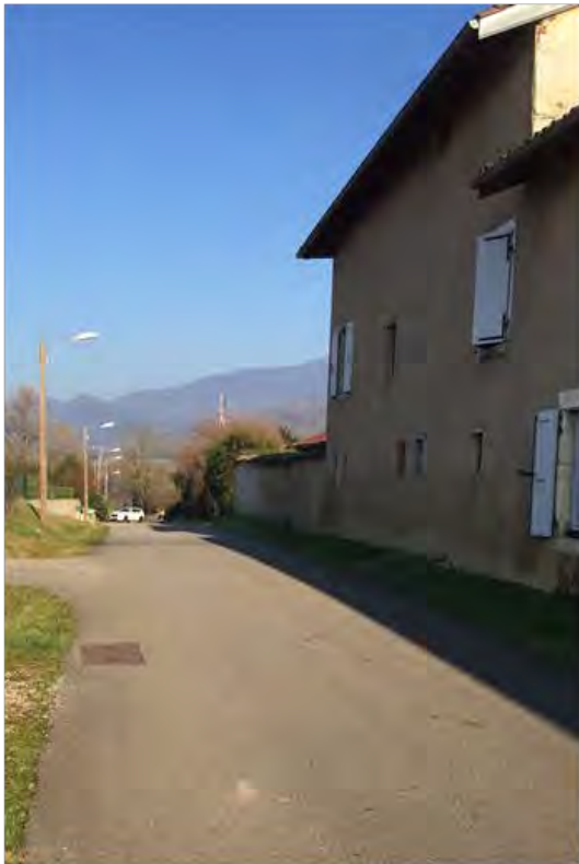
Route de campagne