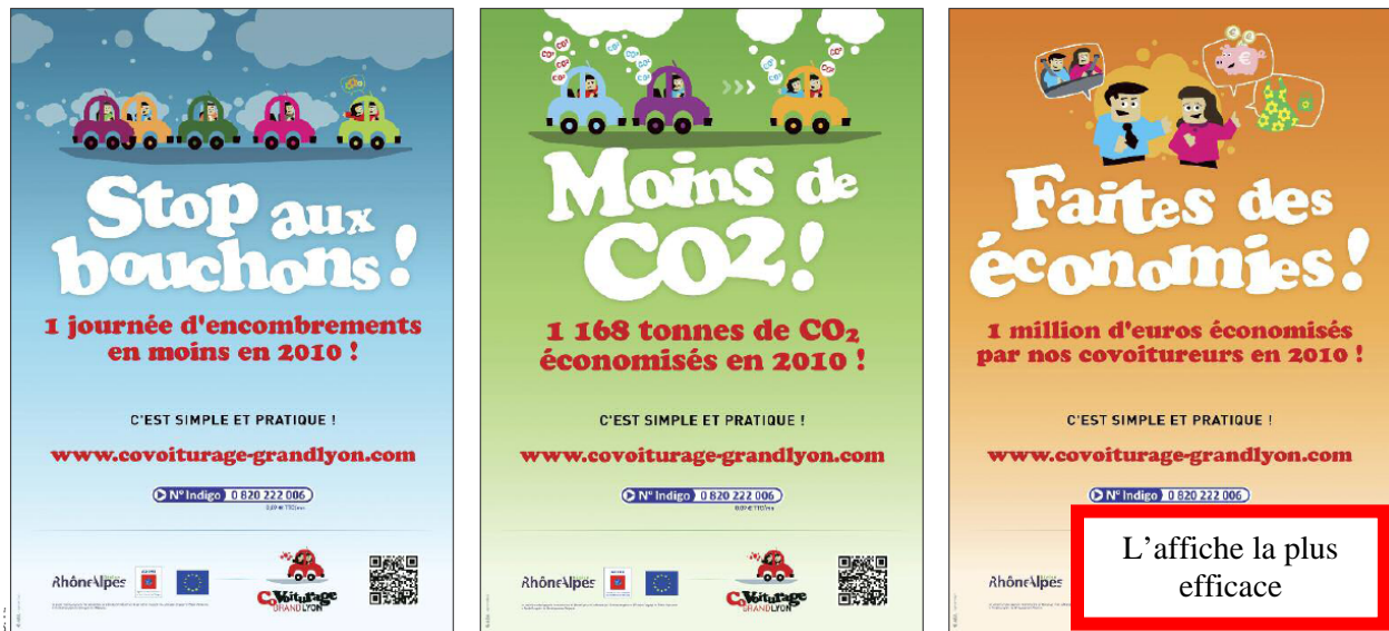
Figure 1 – Résultats du test d'une campagne de communication

Les usagers des mobilités alternatives sont régulièrement interrogés sur leurs motivations mais beaucoup d'enquêtes n'ont donc pas une portée générale car elles se limitent à la petite fraction des pionniers qui ont des préférences de militants. Nous devons plutôt nous intéresser à des situations dans lesquelles l'usage de la voiture solo a reculé à grande échelle. Un premier exemple vient des antipodes 9 et plus précisément de la plateforme de covoiturage de la région de Wellington qui a eu un succès remarquable. Les usagers ont classé leurs motivations ainsi : ça économise de l'argent (55%), c'est plus rapide (13%), c'est plus convivial (10%), c'est bon pour l'environnement (8%), ça diminue les embouteillages (4%). Le second exemple concerne les grandes villes françaises dans lesquelles l'autopartage commence à ébranler le statut de la voiture personnelle. Les usagers énoncent leurs préférences ainsi 10 : prix (59%), flexibilité (19%), voiture à proximité (10%), convivialité (3%), écologie (1%). Des deux côtés de la planète, on retrouve le même profil de préférences avec des intérêts qui pèsent très lourd et des désirs qui pèsent relativement moins.